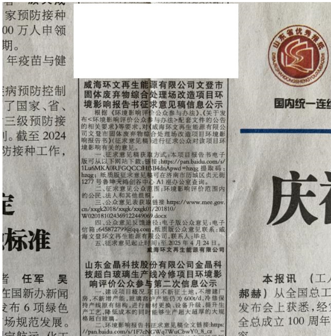
图 3.2-6 报纸第二次信息公示