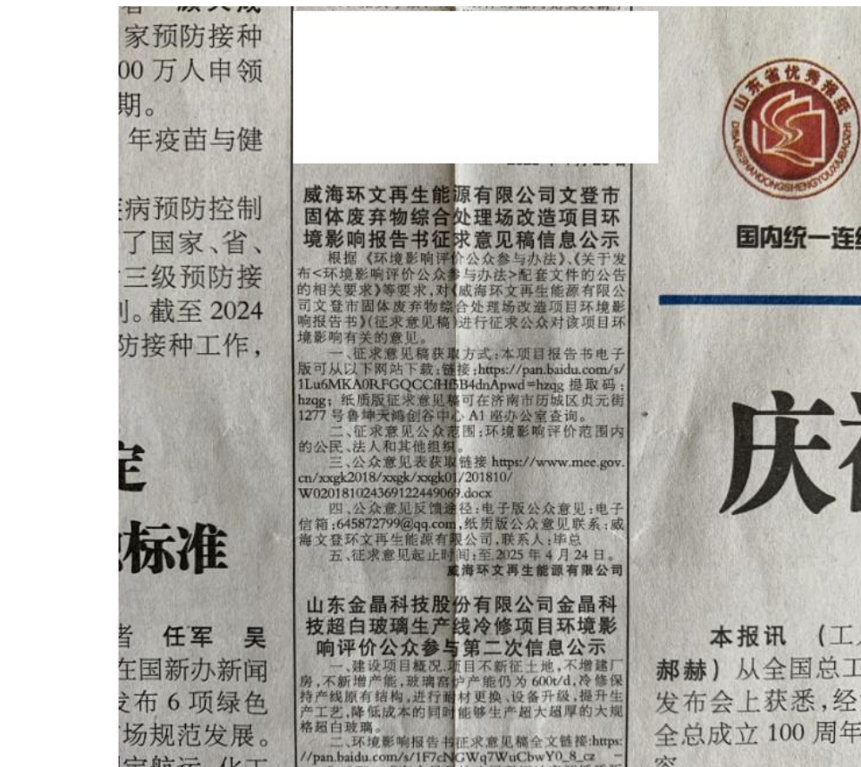
图 3.2-5 报纸第二次信息公示局部