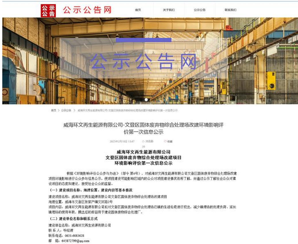
图 2.1-1 第一次信息公示网站截图（局部）

首次环境影响评价信息于 2025 年 2 月 18 日在“公示公告网站( http://www.51gongao.com/sy )”网站公开，链接为： http://www.51gongao.com/newsinfo/8042149.html ；网站公示截图如下：