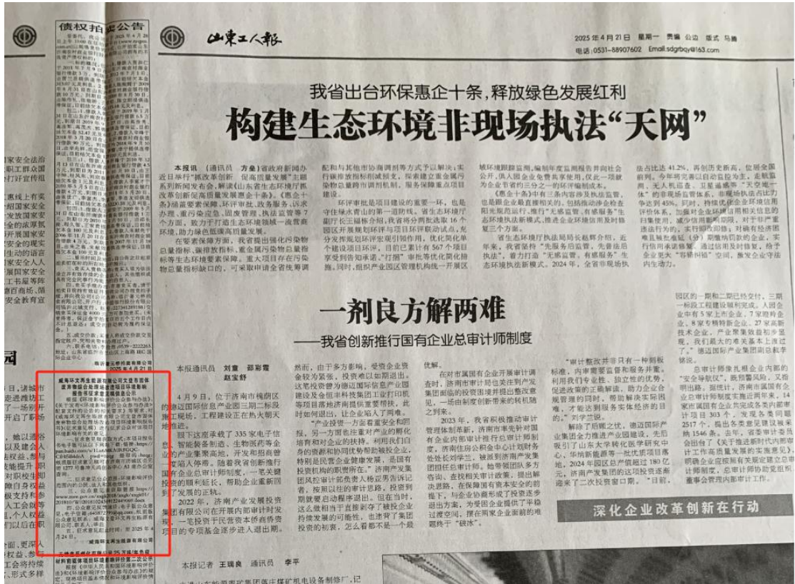
图 3.2-4 报纸第一次信息公示版面