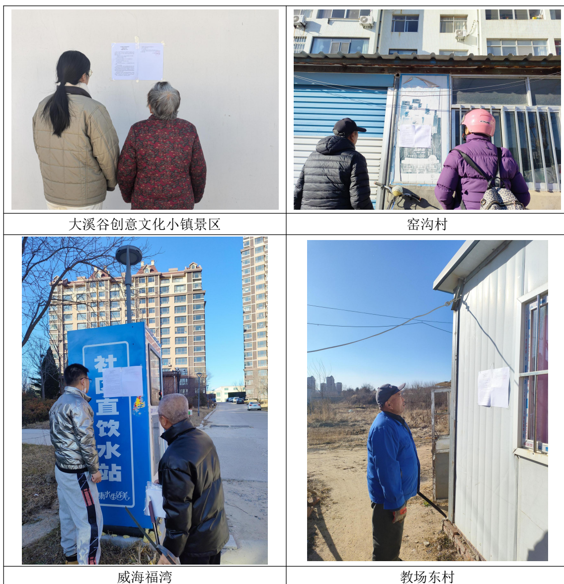
图 3.2-3 征求意见稿公示张贴公示照片