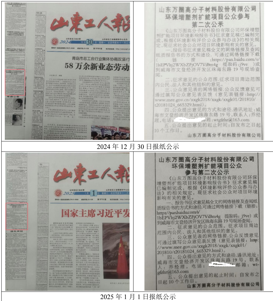
图 3.2-2 征求意见稿公示报纸公示图

本项目征求意见稿公示于 2024 年 12 月 30 日、2025 年 1 月 1 日公示两天。