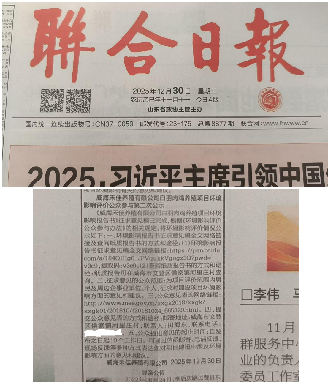
图 3.2-2 (1) 征求意见稿公示报纸公示图 (2025 年 12 月 30 日)