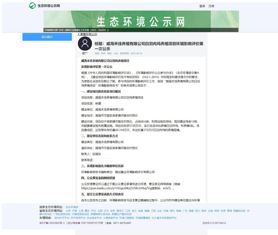
图 2.2-1 首次环境影响评价信息网站公示截图