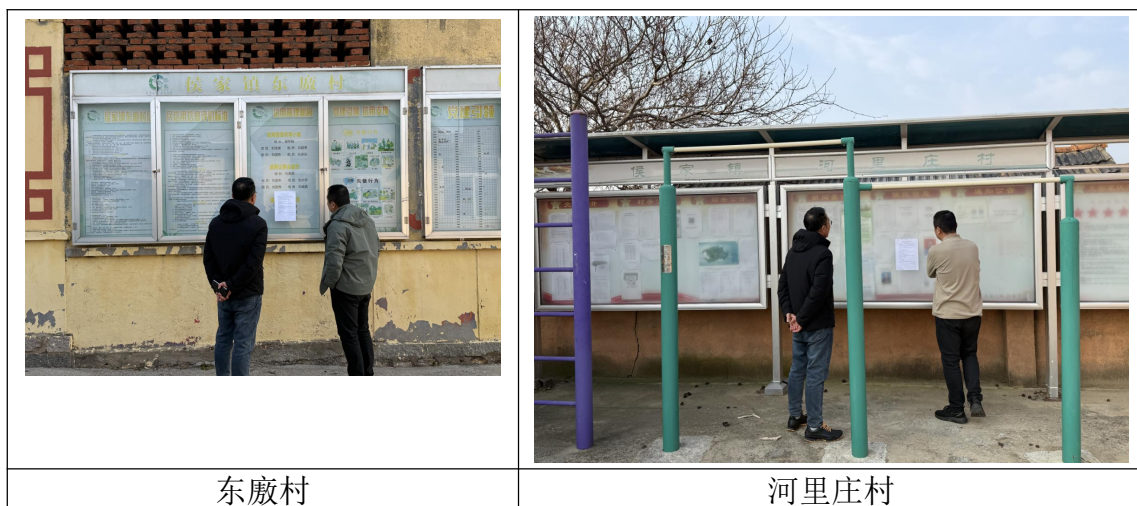
图 3.2-3 征求意见稿公示张贴公示照片