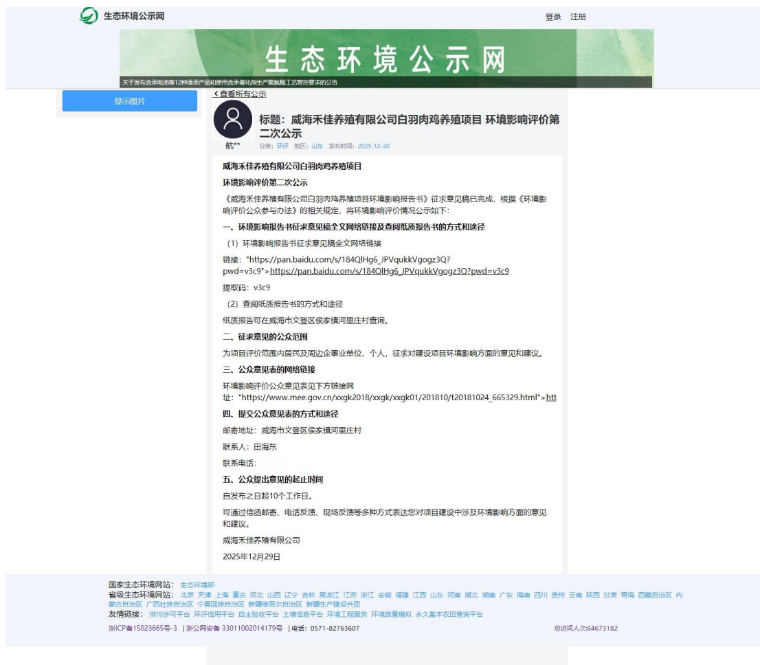
图 3.2-1 征求意见稿公示网站公示截图