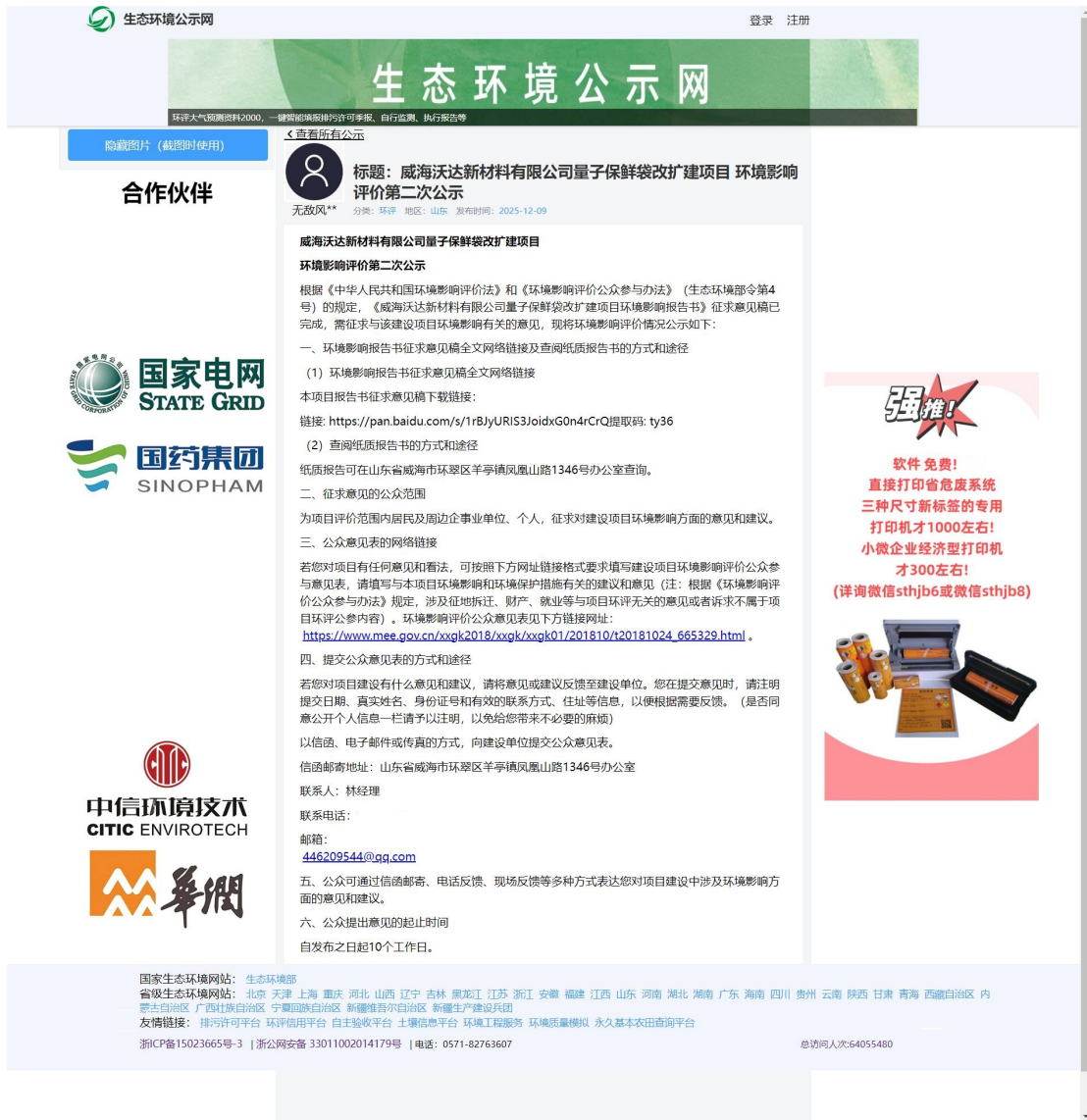
图 3.2-1 征求意见稿公示网站公示截图