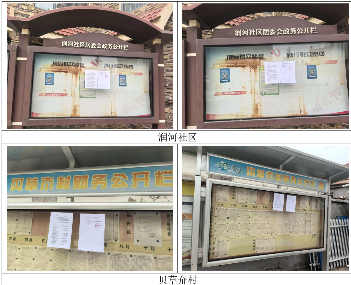
图 3.2-3 征求意见稿公示张贴公示照片