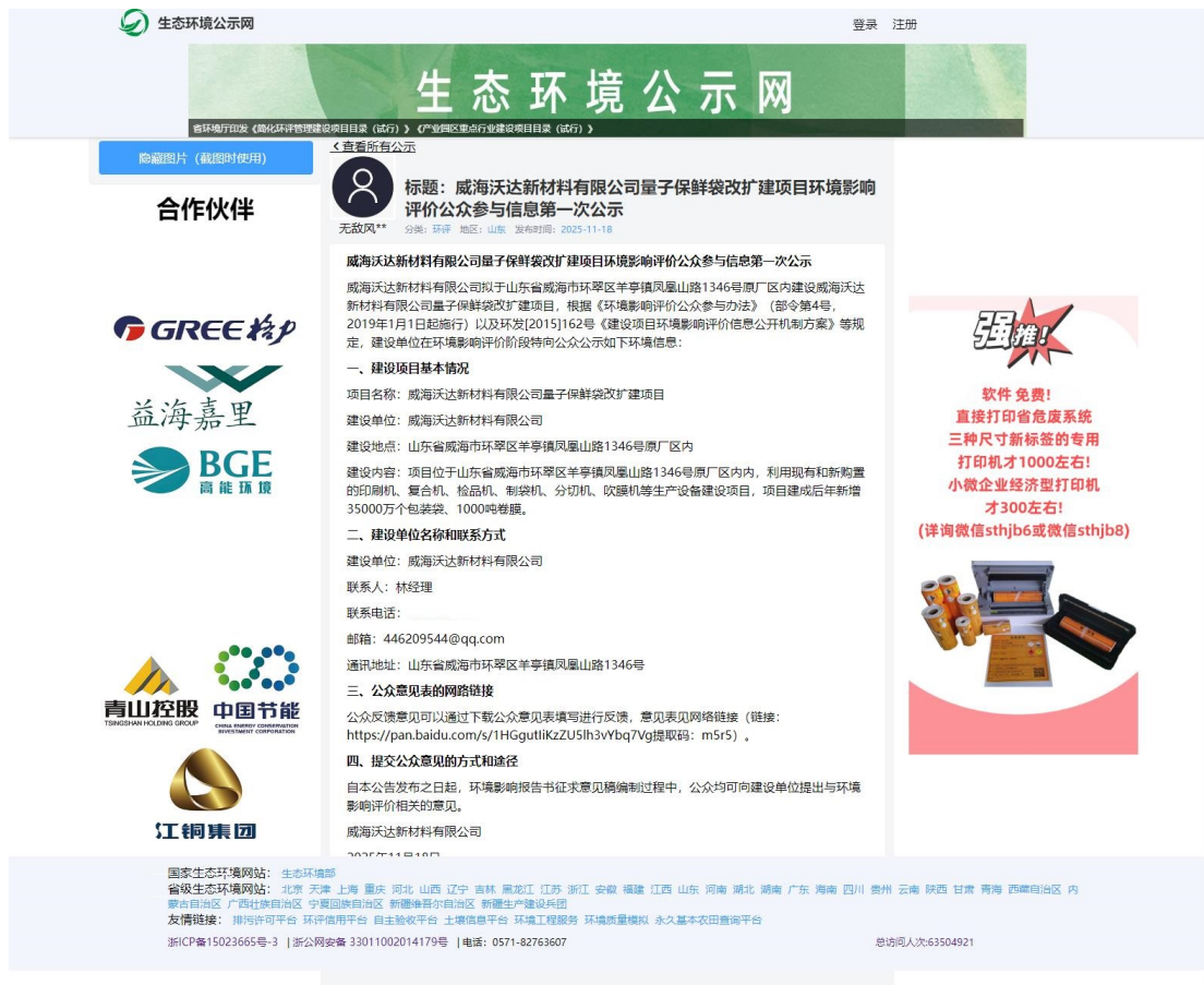
图 2.2-1 首次环境影响评价信息网站公示截图