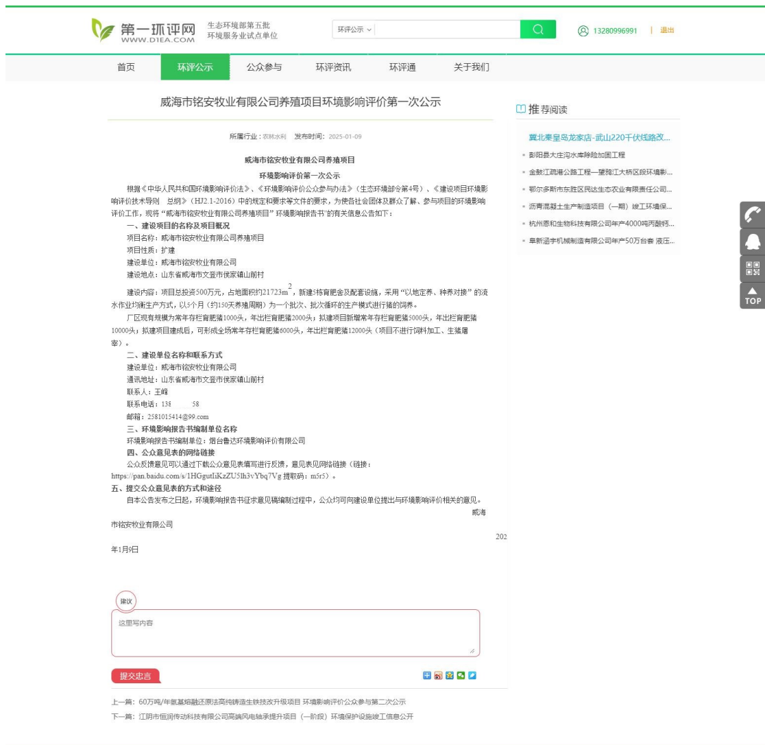
图 2.2-1 首次环境影响评价信息网站公示截图