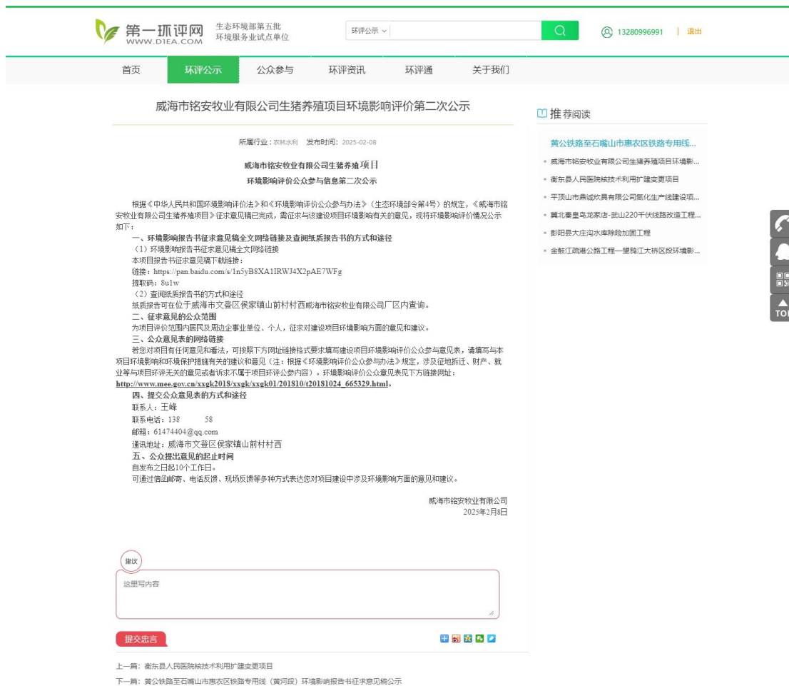
图 3.2-1 征求意见稿公示网站公示截图